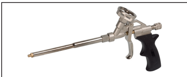
Pistola PU codice 3784