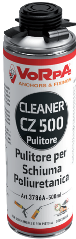
PULITORE PER SCHIUMA

Utilizzabile per rimuovere la schiuma non polimerizzata da