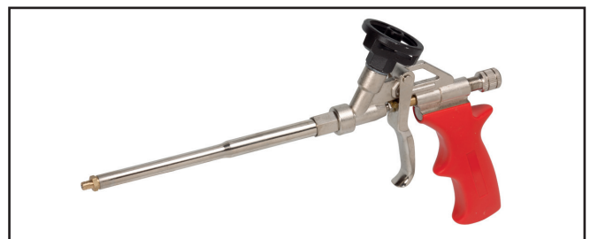
Pistola PU PLUS modello professionale codice 3785